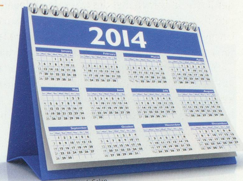
Benjamin Albiach Galan

12 CALENDRIER Beaucoup de musées sont gratuits un jour par mois , alors que les cinémas font souvent des prix spéciaux certains jours de la semaine.