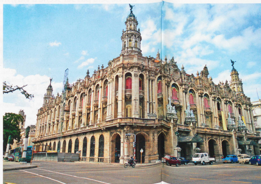
L'architecture coloniale est toujours là, les grosses voitures américaines aussi. Même si le progrès est en train de forcer sur cette île trop longtemps coupée du monde occidental.

A Guamá, plus à l'est, le décor est tout autre, puisqu'une île marécageuse trône au milieu d'une lagune. On y trouve un hôtel sur pilotis et un élevage de crocodiles. La nature a été généreuse avec cette île, en lui offrant des paysages aussi diversifiés qu'enchantés. Les hommes aussi ont bâti des trésors architecturaux. Comment ne pas tomber amoureux des rues étroites et pavées de Trini-