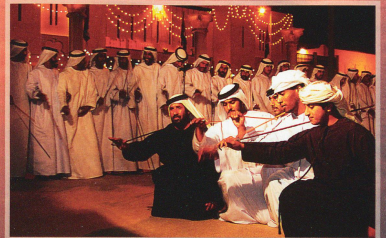
Au pied des buildings, la tradition trouve encore sa place avec ces musiciens et leurs instruments typiques