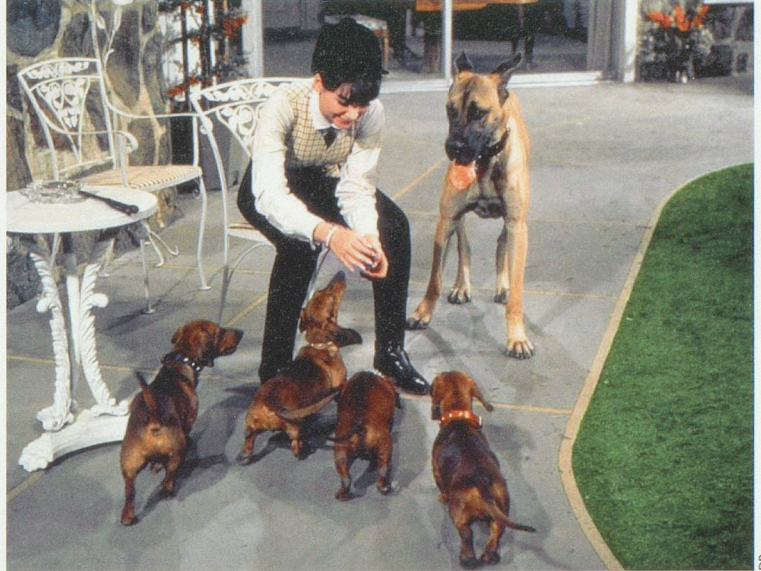
Quatre bassets pour un danois, un bon vieux Walt Disney qui fera le bonheur des petits et des grands.

Sinon, réfugiez-vous au rayon des classiques avec Les 101 dalmatiens , La belle et le clochard ou encore Chiens des neiges avec Cuba Gooding JR, dans le rôle du pauvre type vivant en Floride et qui hérite d'un attelage de chiens polaires en Alaska. Cerise sur la pâtée, un vrai classique du genre qui date de 1967: Quatre bassets pour un danois . Petit résumé: Madame s'emmourache