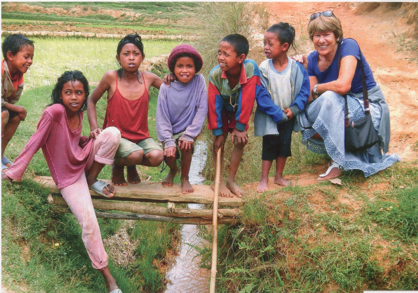
J'AIDE LES AUTRES