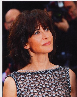
Sophie Marceau, 49 ans: un air de jeunesse!

Les bons produits: The Body Shop, Honey Bronze bronzing powder, 29 fr. 90