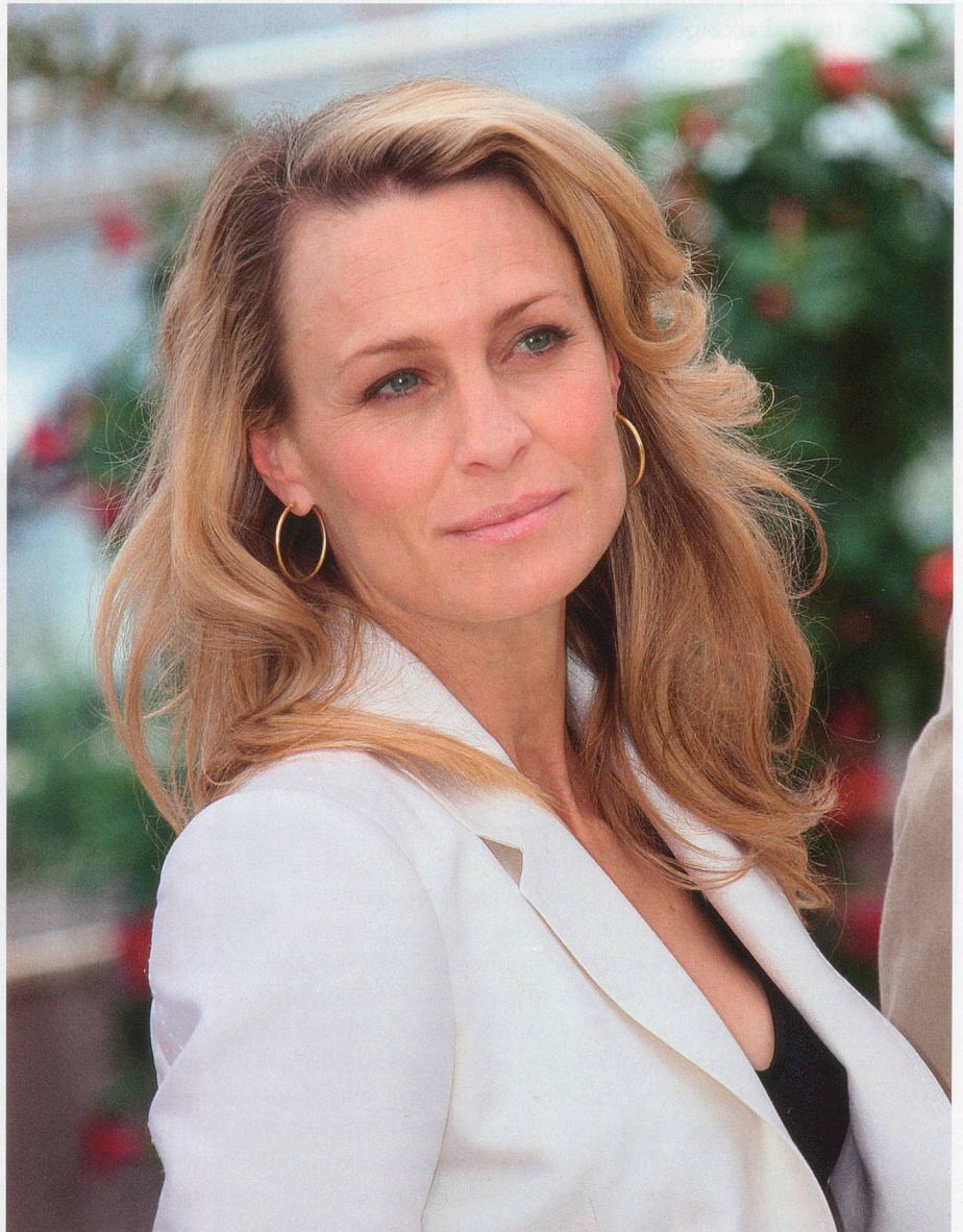
Ex-femme de Sean Penn et héroïne de la série House of cards , Robin Wright affiche toujours un teint radieux à l'aube de ses 50 ans.