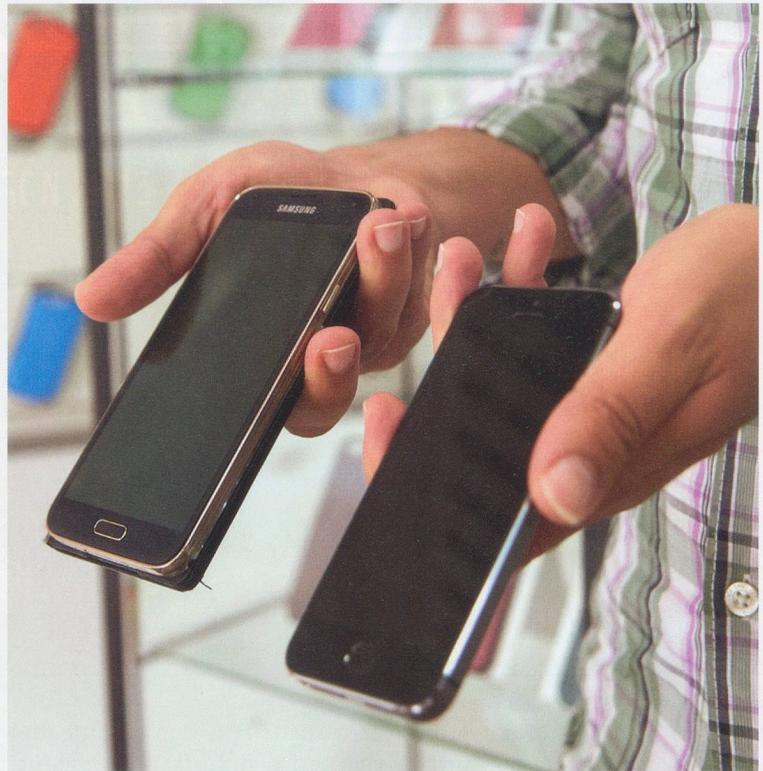
Le marché de l'occasion est en plein boom. Une aubaine pour les petits budgets.

C'est également le cas chez M-Budget, qui vend en ligne, depuis le début de l'été, des smartphones reconditionnés d'Apple et Samsung, garantis 1 an, jusqu'à 50% moins chers. Ainsi,