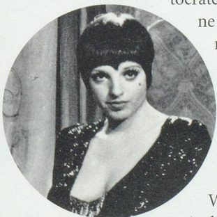
Liza Minnelli, star du film sorti en 1972.

Inspiré du livre Goodbye to Berlin (Adieu à Berlin) publié en 1939, Cabaret est l'histoire de Sally Bowles, une chanteuse américaine, et de Brian, un Anglais qui écrit sa thèse de philosophie. Les deux amants tomberont sous la coupe d'un riche playboy, Max. Un aristocrate persuadé que la peste brune ne gagnera jamais l'Allemagne, même s'il se réjouit des plans nazis pour se débarrasser du communisme. C'est dans cette ambiance de fin de règne, ou plutôt de la disparition programmée des libertés et de la République de Weimar, que les protagonistes évoluent. L'antisémitisme monte en puissance et le dernier cabaret de Berlin fermera en 1935.