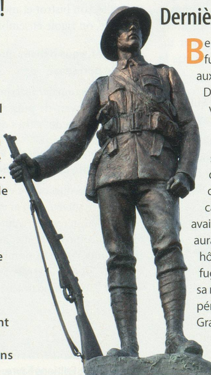
Awe Inspiring Images

B ernard Jordan, le vétéran britannique qui avait fugué de sa maison de retraite pour assister aux commémorations du 70 e anniversaire du Débarquement, s'en est allé pour un dernier voyage. En juin 2014, l'histoire de cet homme avait ému le monde entier. Il avait quitté en douce son établissement de soins dans le sud-est de l'Angleterre pour rejoindre ses anciens camarades en Normandie. Avec ses médailles cachées sous son manteau, l'intépide retraité avait emprunté seul un train et un ferry, où il en aurait même profité pour faire du charme aux hôtesses de bord. C'est après deux jours de fugue que le vétéran avait finalement regagné sa maison de retraite, devenant la star d'un périple que les médias avaient nommé «la Grande Evasion». Le 6 janvier 2015, Bernard Jordan a entrepris une dernière fugue vers l'au-delà, où il a sans doute rejoint ses frères d'armes.