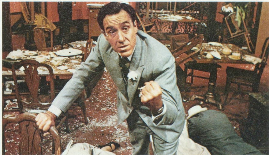
En 1929, la guerre des gangs battait son plein à Chicago. Elle trouvera son apothéose avec le massacre du 14 février.

Bref, pour en revenir au jour des amoureux, c'est bien le 14 février 1929