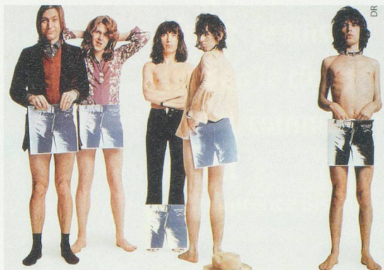
Les Rolling Stones en 1971