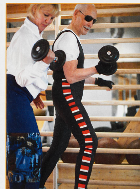
FITNESS Le Suisse Charles Eugster, alors qu'il avait 90 ans. Depuis plus de 30 ans, il se bat pour prouver qu'on peut rester en bonne santé sans médicaments, à l'exception de vitamines et de protéines sans oublier une bonne dose d'activité physique.