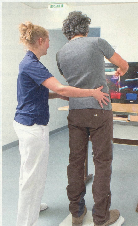
Physiothérapie, piscine et même jardinage, tout est fait afin que le patient puisse retourner chez lui dans les meilleures conditions. Ici à la clinique de Valmont.

Autre axe primordial du programme: l'ergothérapie. C'est dans ce service qu'est effectué le premier bilan du patient, pour connaître son degré d'indépendance avant l'hospitalisation et ses ambitions de réadaptation. C'est là aussi qu'il va apprendre à se mouvoir dans son propre environnement (chambre à coucher, salle de bain, cuisine, etc.) de la manière la plus sûre et la plus adaptée à son éventuel handicap, et comment effectuer bon nombre de gestes du quotidien: s'asseoir et se relever, se coucher et se lever du lit, porter des objets lourds ou des cabas, se relever en cas de chute, mettre ses chaussettes (avec un enfile-chaussettes), etc.