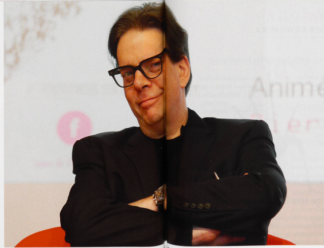
«Mes lecteurs ont beaucoup d'importance pour moi.» explique l'auteur, ici à son livre de Paris en mars dernier.

Mon père irlandais et ma mère juive sont un exemple de couple raté qui a survécu. A cause ou grâce à leurs désaccords, je suis devenu rapidement