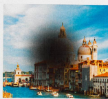
Début de DMLA