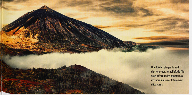
Une fois les plages du sud derrière vous, les reliefs de l'île vous offriront des panoramas extraordinaires et totalement dépayés!