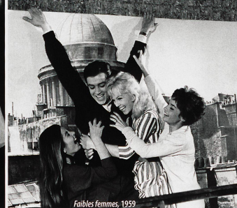
Faibles Femmes, 1959

prendre comment j'ai pu porter de la fourrure. C'était la mode, mais quand même. En tout cas, je suis devenue végétarienne! Je mange les œufs de mes poules, mais pas plus. Je suis aussi une militante de la cause animale: je viens de lancer sur mon site une pétition contre l'expérimentation animale, qui ne sert à rien, aujourd'hui cela a été prouvé.