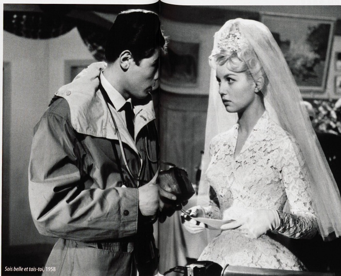
Sois belle et tais-toi, 1958