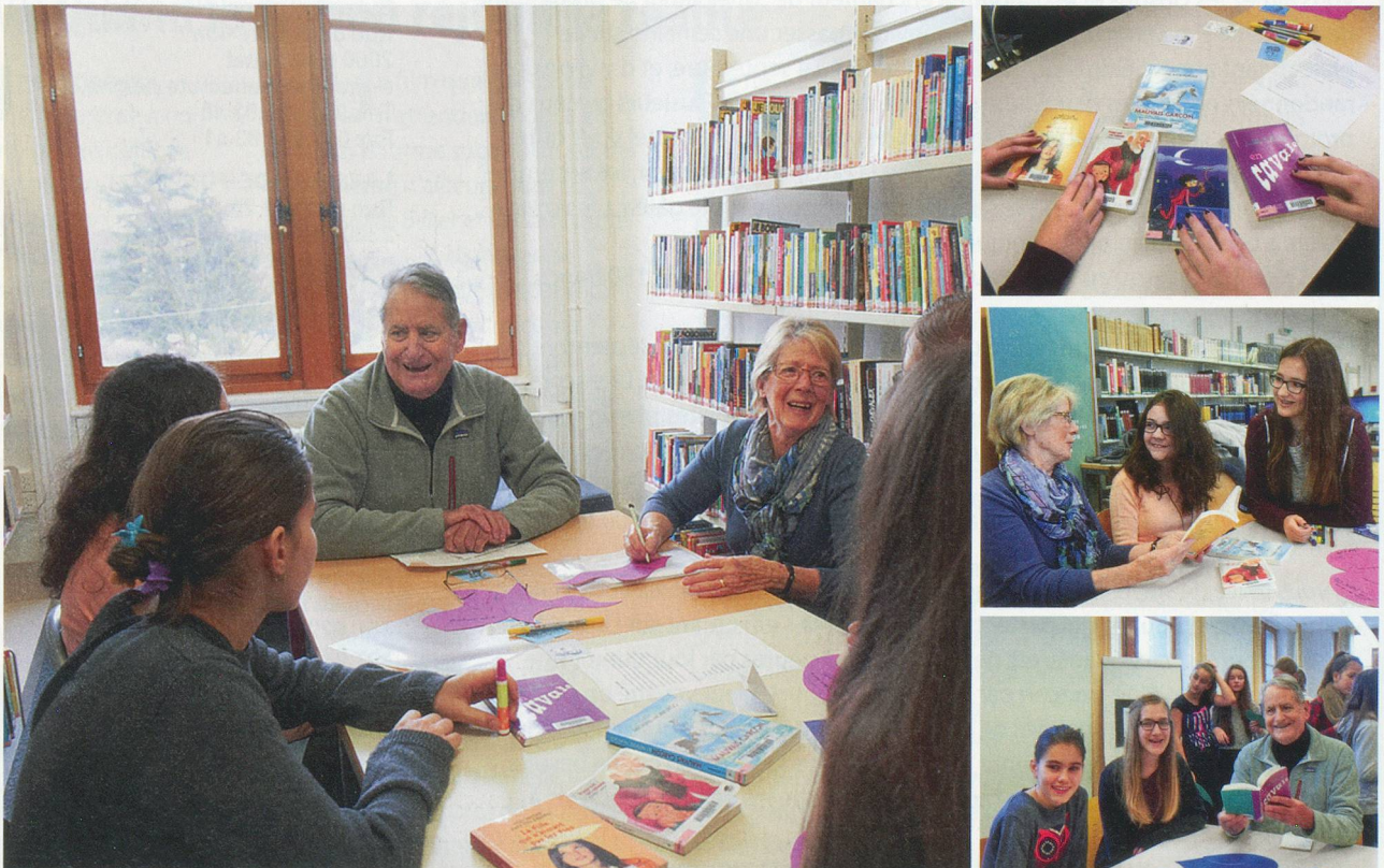
A Yverdon-les-Bains, en février dernier, adolescents et adultes ont échangé avec passion sur la littérature intergénérationnelle.