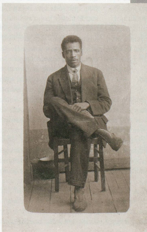
C'est à travers cette photo sépia de son grand-père que l'écrivain a commencé sa dernière aventure littéraire.

A travers une photo sépia que j'ai de lui dans mon bureau et qui représente un beau jeune homme noir en costume trois-pièces et cravate dans les années