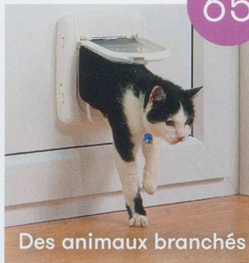
Des animaux branchés