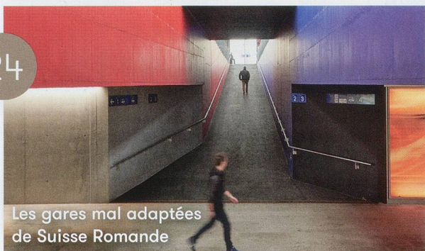
Les gares mal adaptées de Suisse Romande