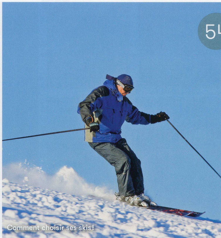
Comment choisir ses skis!