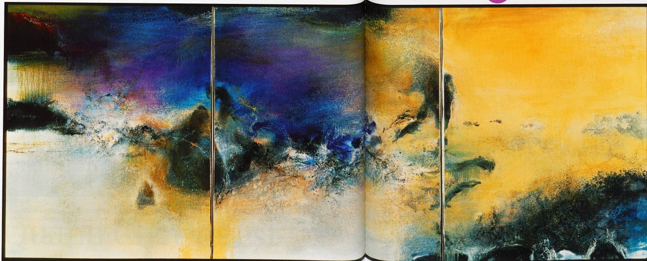
27.08.82-Triptyque Collection particulière Le maître franco-chinois de l'abstraction du paysage ne décrivait pas ses œuvres, ne cherchait pas à les expliquer et leur attribuait rarement un titre.