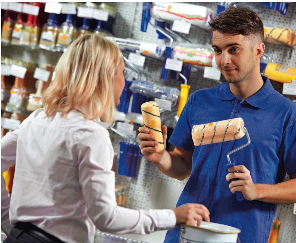
Avant de vous rendre dans un magasin, définissez les couleurs qui vous plaisent. Et attention: repeindre les murs de son chez-soi demande du savoir-faire!

vives. Mais ce n'est pas toujours le cas! Alors que choisir? Tout dépend des fonctions de chaque pièce et de l'ambiance que l'on désire y mettre. Petite visite des lieux, pour vous aider dans vos choix et vous donner un peu d'inspiration.