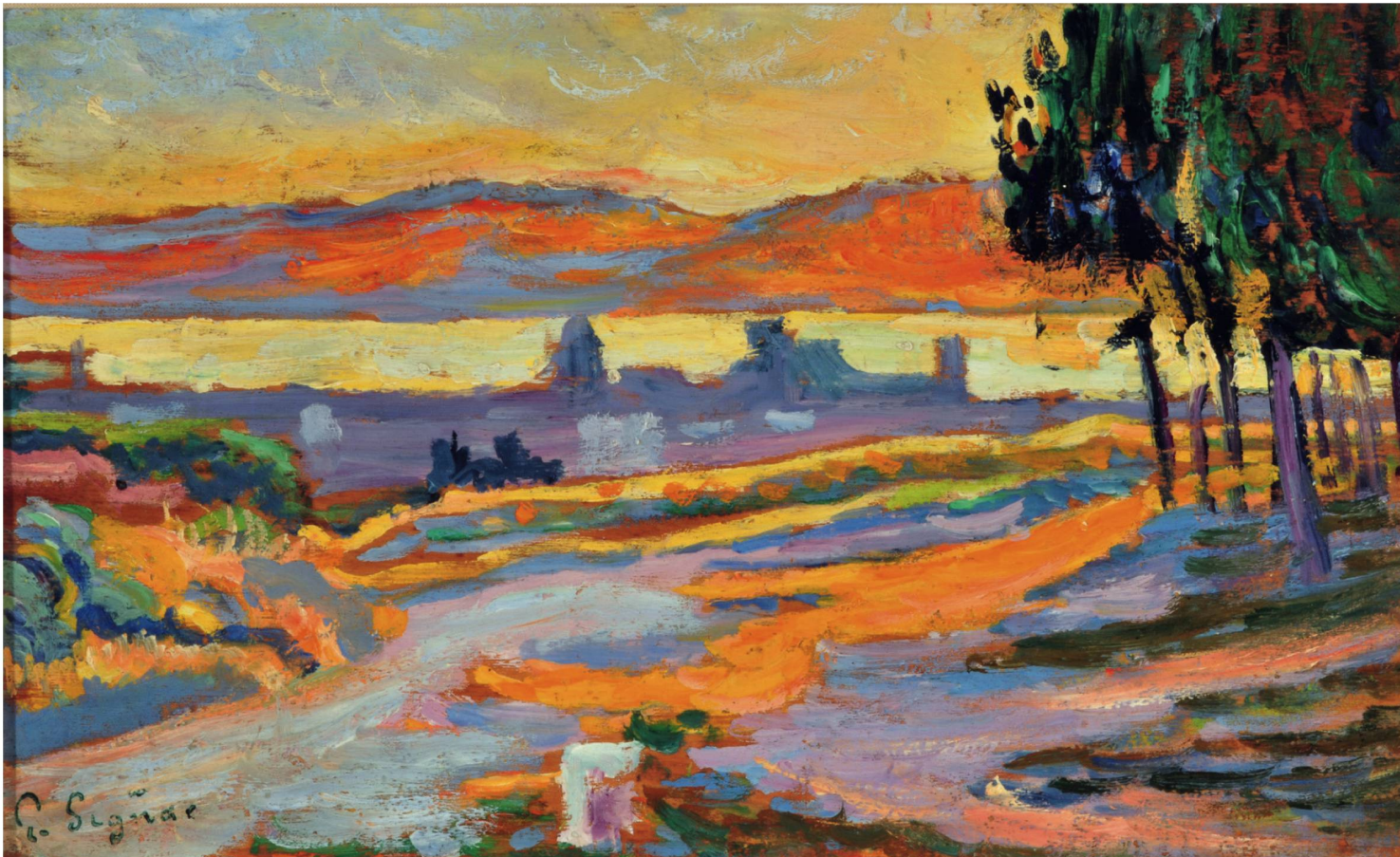
Soleil couchant sur la ville (étude), 1892 , huile sur bois, 15,5 x 25 cm, collection privée A Saint-Tropez, Signac s'essaie à l'aquarelle, qui devient dès lors une de ses techniques de prédilection.