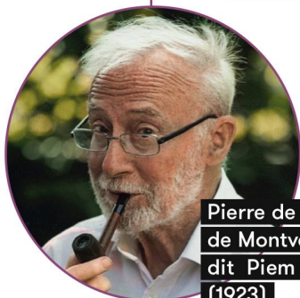
Pierre de Barrigue de Montvallon, dit Piem (1923)