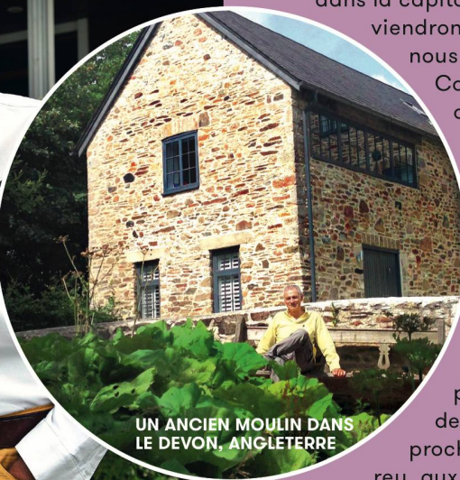
UN ANCIEN MOULIN DANS LE DEVON, ANGLETERRE