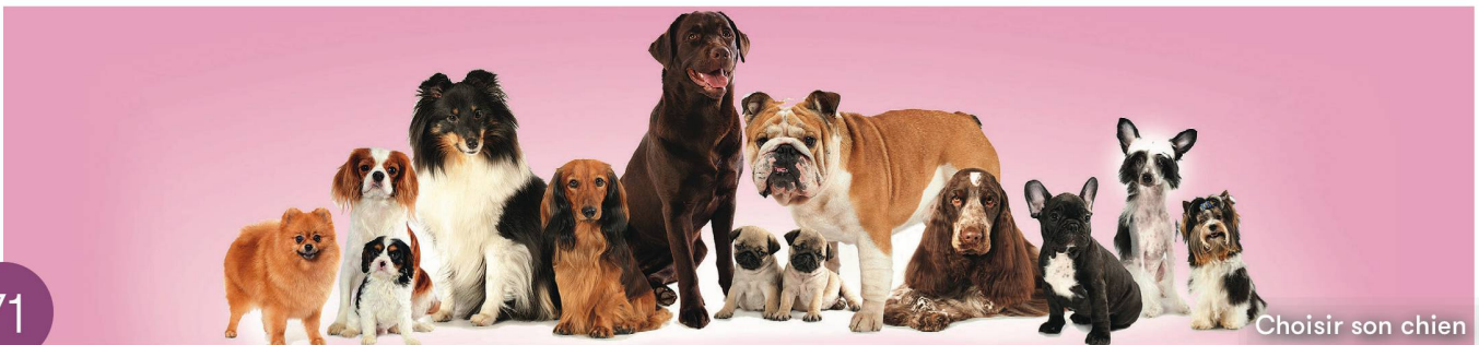
Choisir son chien