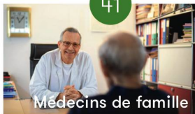
Médecins de famille