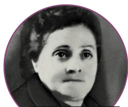
Prénom absent (décédée en 1950)