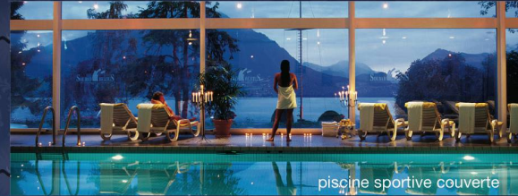
piscine sportive couverte

Cet arrangement spécialement préparé pour vous comprend les prestations suivantes