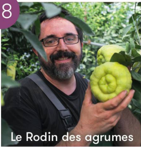
Le Rodin des agrumes