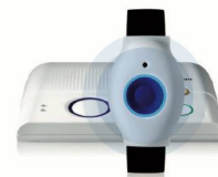
SmartLife Care Genius le parfait colocataire pour une sécurité sur mesure