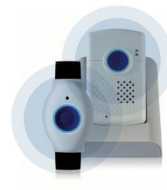
SmartLife Care Mini le compagnon discret avec module GPS