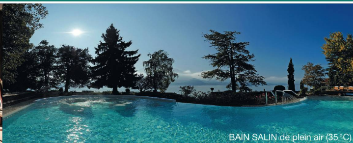
BAIN SALIN de plein air (35 °C)