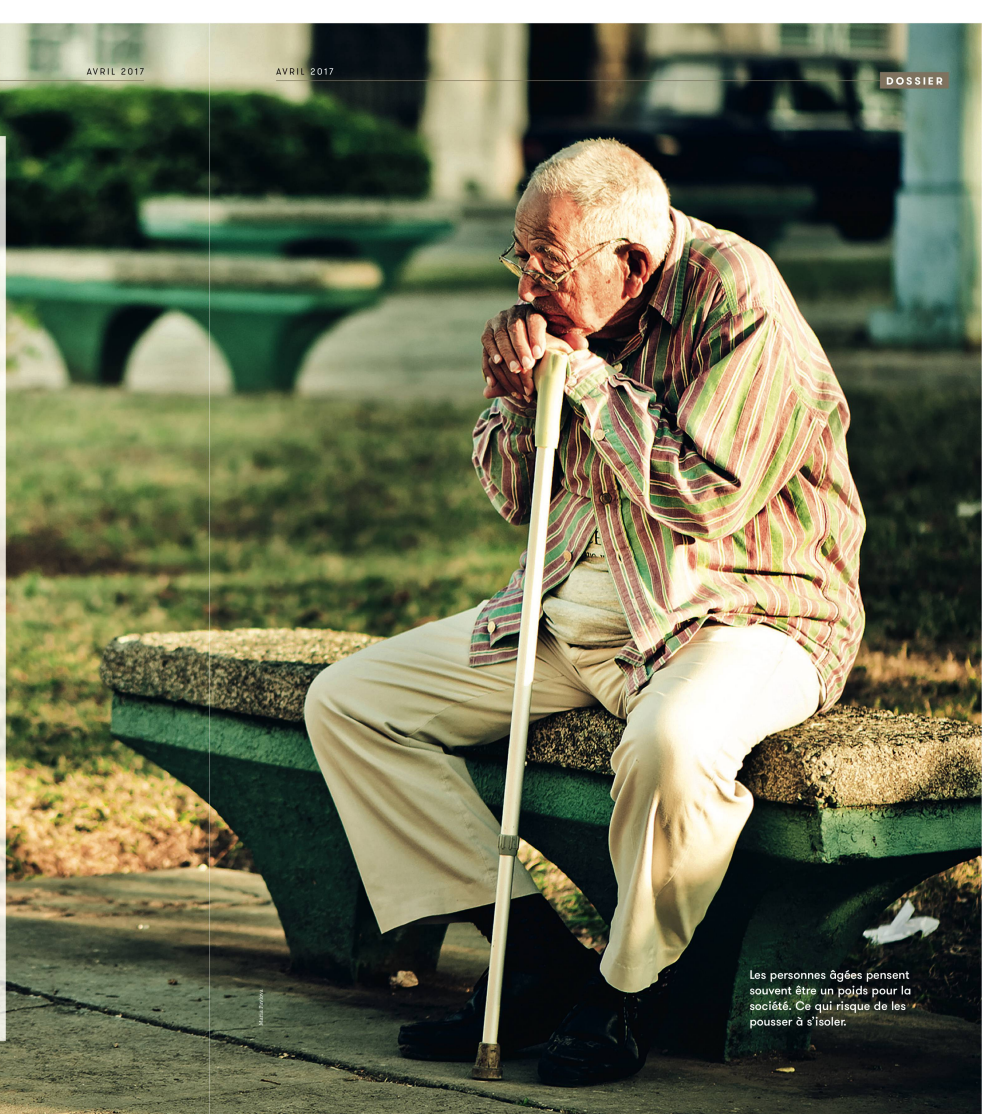
Les personnes âgées pensent souvent être un poids pour la société. Ce qui risque de les pousser à s'isoler.

Et c'est bien là tout le problème. La dépression chez la personne âgée n'est souvent pas reconnue ou mal diagnostiquée, car elle peut facilement être attribuée au processus de vieillissement et être masquée par des troubles somatiques : « On pense que c'est normal que l'aîné soit triste. Si la détection de la dépression peut être problématique à tout âge, quand la personne est âgée, d'autres symptômes, plus apparents, sont pris en compte et priment souvent. Les troubles de l'humeur sont moins identifiés et, quand ils le sont, souvent, ils ne sont >>>