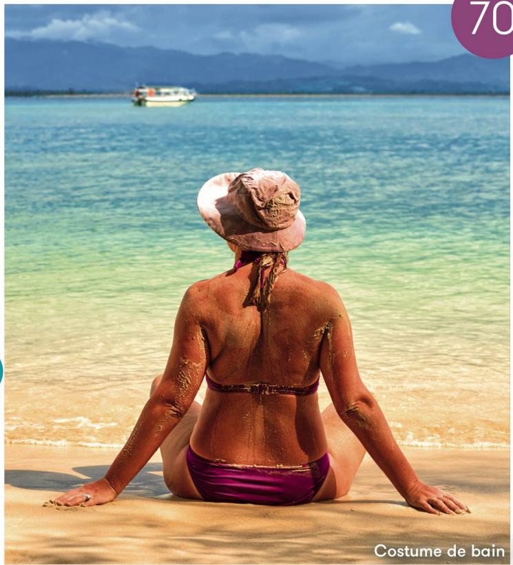
Costume de bain