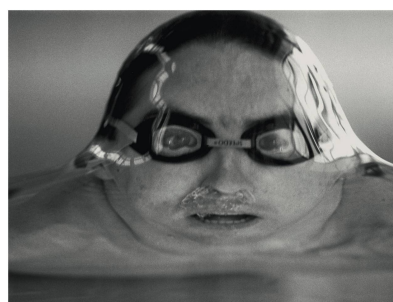
L.O. (D. Dumas/Photomontage), T. (S. Giffoni), Ben Giffoni/Star Martin

L'art de photographier le sport, jusqu'au 19 novembre au Musée olympique, de Lausanne.