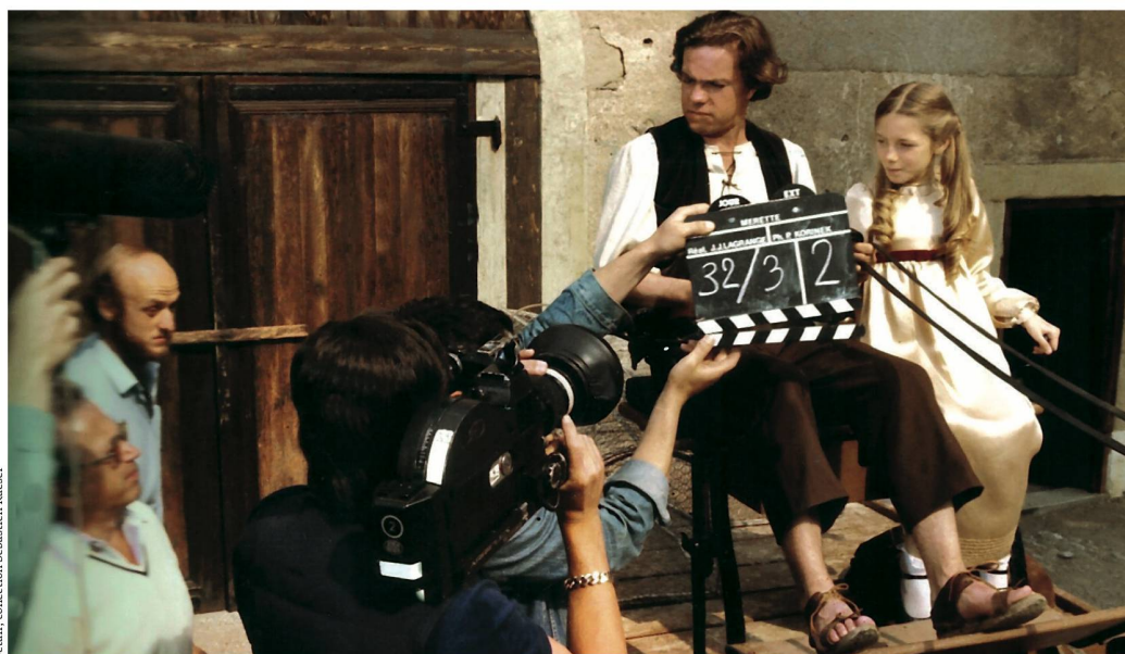
D tail, collection Sebastian Knaefer