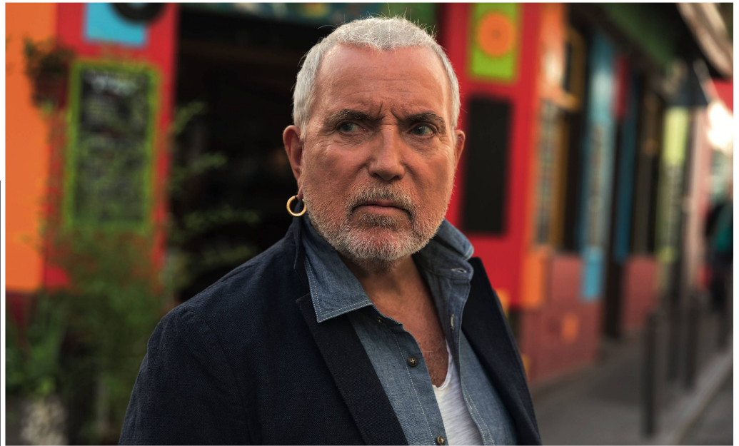
A 71 ans, Bernard Lavilliers tient la grande forme. De la boxe tous les jours et une ouverture sur le monde bien propre à lui.

Toujours. Ce sont des impressions. Des phrases qui entrent en réverbération. Cela m'aide à mieux prendre