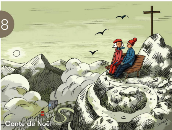
Conte de Noël