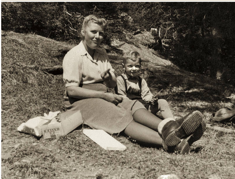
Mus e de Sainte-Croix