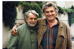
Été 1996.