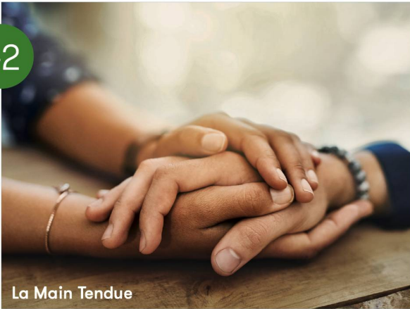
La Main Tendue