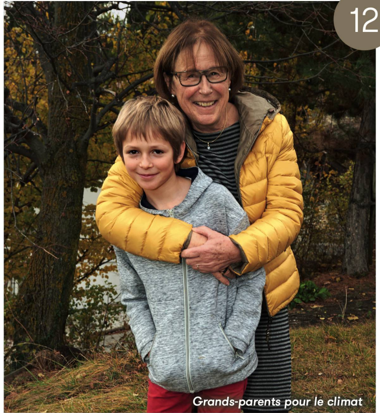
Grands-parents pour le climat