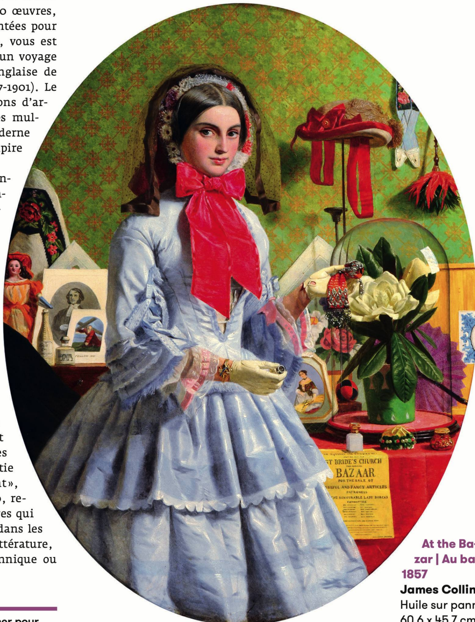
At the Bazaar | Au bazar, 1857

La peinture anglaise de Turner à Whistler, du 1 er février au 2 juin 2019, à la Fondation de l'Hermitage, à Lausanne