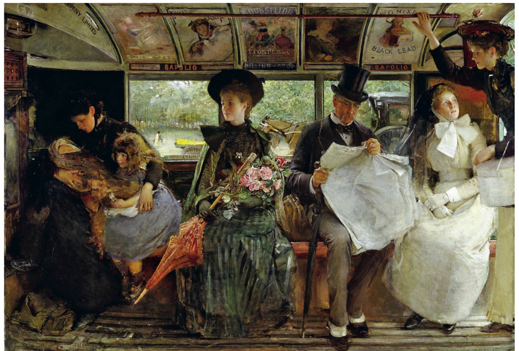
The Bayswater Omnibus | L'omnibus de Bayswater, 1895