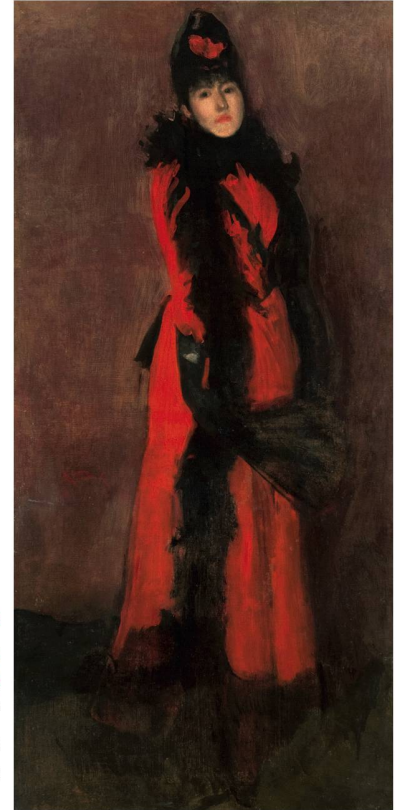
Red and Black : The Fan | Rouge et noir : l'éventail, 1891/1894