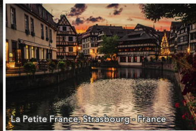
La Petite France, Strasbourg - France