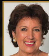
Roselyne Bachelot Invitée exceptionnelle