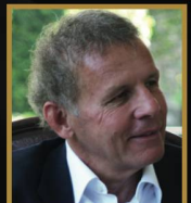
Patrick Poivre d'Arvor Invité exceptionnel

En partenariat avec Bliithner THE GOLDEN TONE