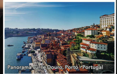
Panorama sur le Douro, Porto - Portugal