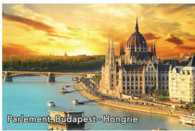
Parlement, Budapest - Hongrie