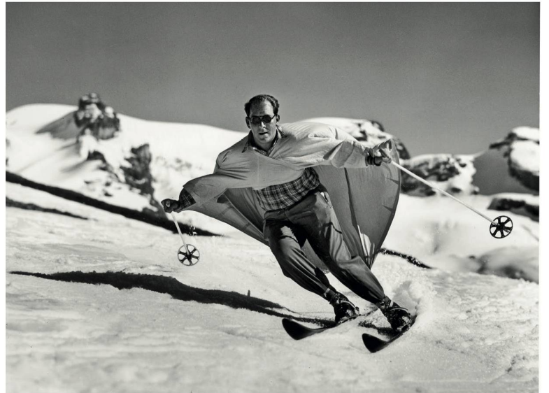
Engelberg Un drôle de skieur volant à pleine vitesse.