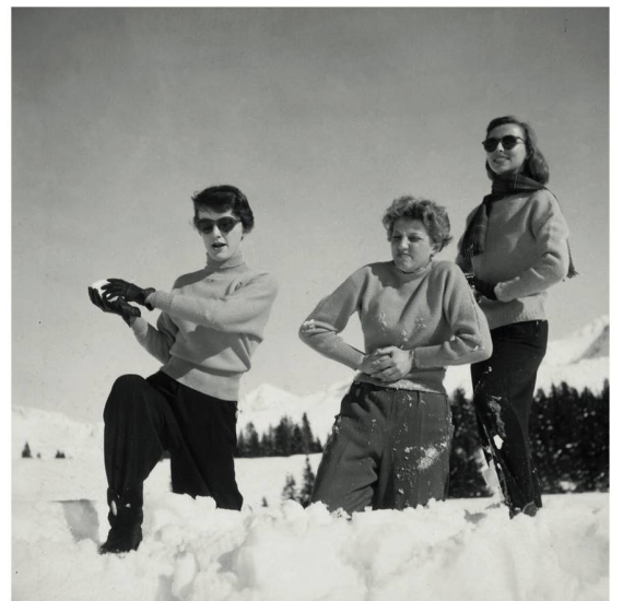
Détente Une bataille de boules de neige?