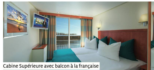
Cabine Supérieure avec balcon à la française