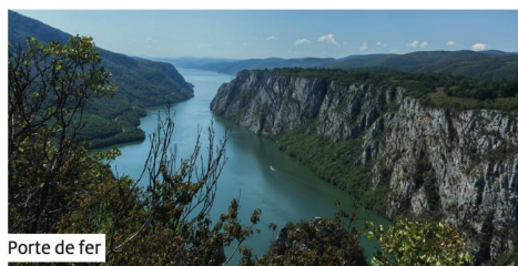
Porte de fer