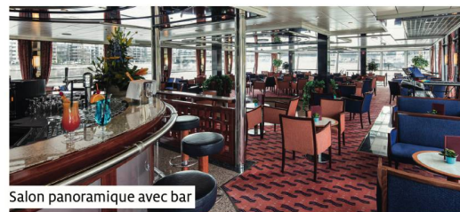
Salon panoramique avec bar