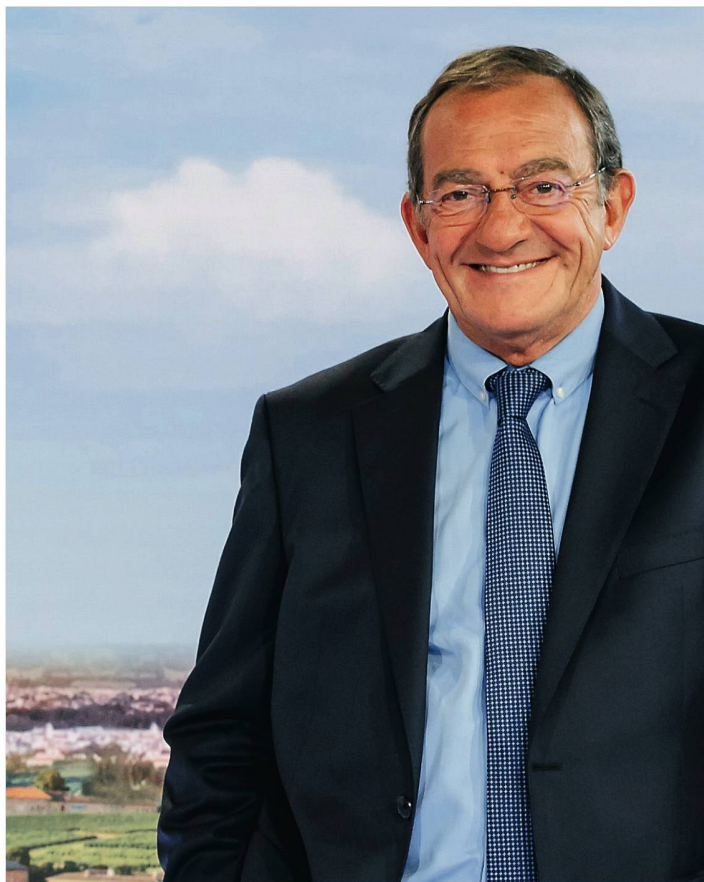
Jean-Pierre Pernaut veut continuer jusqu'en 2024, au moins.

Grand oublié des Césars, le film de Gilles Lelouche a souvent été vendu comme une comédie. Erreur, c'est plutôt le portrait d'une bande de loosers qui se retrouvent dans le bassin pour former une improbable équipe de natation synchronisée masculine. Alors oui, il y a quelques moments drôles, notamment devant un tel manque de grâce. Mais c'est surtout touchant, terriblement humain. A voir donc, sans oublier un casting impeccable. Le grand bain, 122'