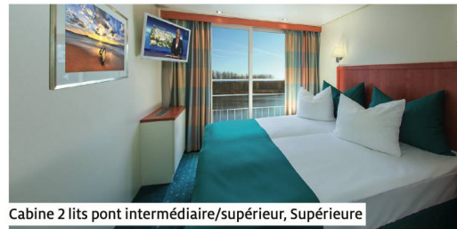
Cabine 2 lits pont intermédiaire/supérieur, Supérieure