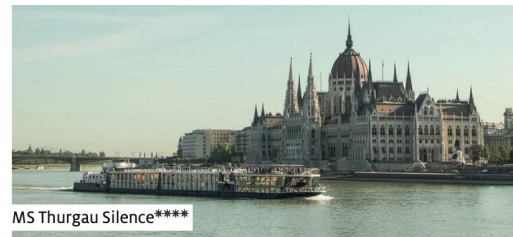
MS Thurgau Silence****

(1) Incluse dans le forfait d'excursions, peut être réservée à l'avance | (2) Contre supplément au forfait d'excursions, peut être réservée à l'avance | (5) balcon à la française Sous réserve de modifications du programme | Compagnie maritime / société partenaire: KD/River Chefs