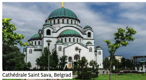
Cathédrale Saint Sava, Belgrad

Bateau doté de 97 cabines élégamment décorées, 194 hôtes. Les cabines (env. 13 m 2 ) sont équipées de douche / WC, sèche-cheveux, télévision / radio, téléphone, coffre-fort et climatiseur. Dans les cabines standards, un lit peut être rabattu vers le mur durant la journée. Les cabines supérieures disposent d'un lit double avec deux matelas. Les cabines situées sur le pont intermédiaire et le pont supérieur ont des balcons à la française, celles situées sur le pont principal ont des hublots qui ne s'ouvrent pas. Infrastructures: restaurant et salon panoramique avec bar, café, boutique, sauna, pont soleil avec voile solaire, chaises longues, fauteuils et tables. WLAN à Wi-Fi gratuit selon disponibilité. Bateau non-fumeur (Il est autorisé de fumer sur le pont soleil).