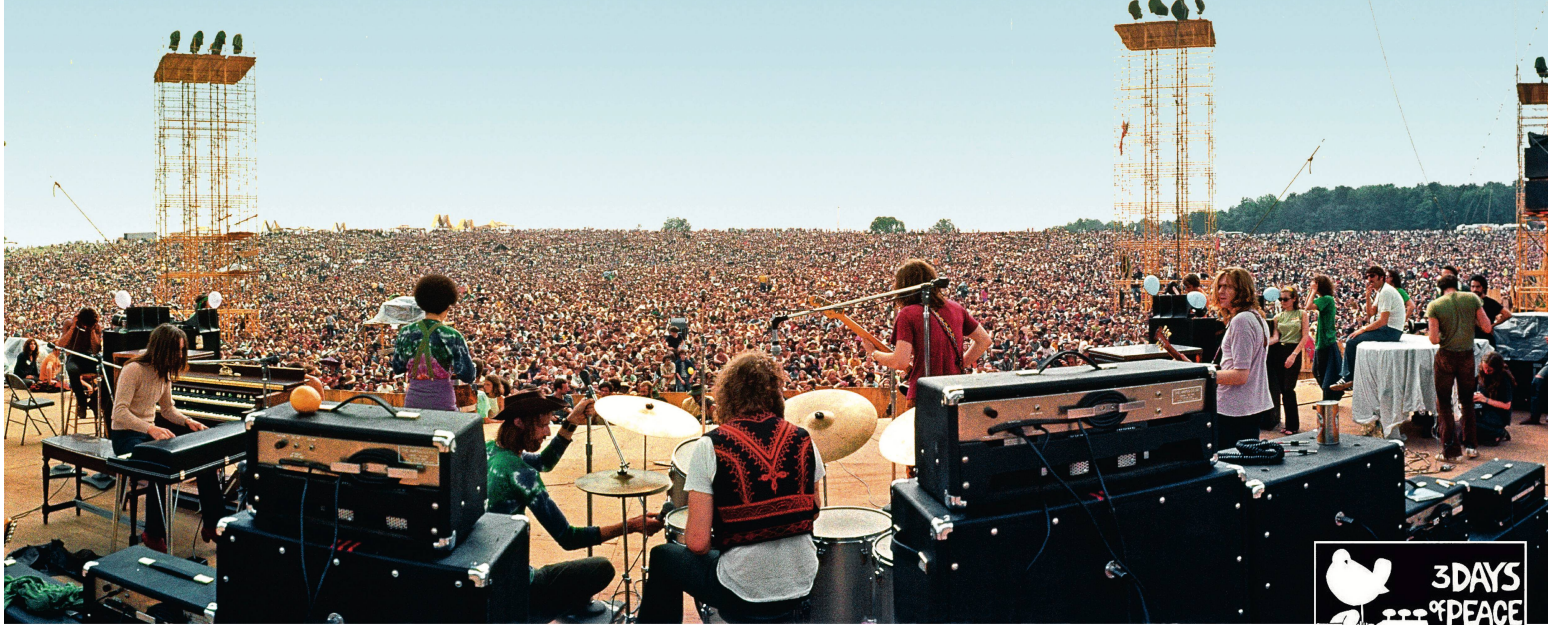
Une marée humaine sur le champ de Bethel. Après trois jours de musique ininterrompue, The Grease Band, le groupe de Joe Cocker ceaux, et c'est avec With a little help from my friends des Beatles qu'il va entrer dans l'histoire.