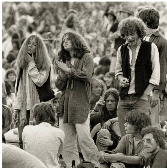
A ses débuts, le Paléo était imprégné de culture

J'étais un mordu de musique. Je m'étais essayé à la guitare, mais sans aucun talent. J'aimais beaucoup la pratique du sport aussi. Je faisais du basket, je jouais au hockey sur glace et au foot.