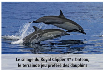
Le sillage du Royal Clipper 4** bateau, le terrain de jeu préféré des dauphins