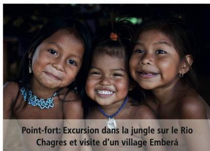
Point-fort: Excursion dans la jungle sur le Rio Chagres et visite d'un village Emberá

Avec le Royal Clipper, vous ressentirez l'émotion de la navigation à la voile, mais la comparaison s'arrête là: à bord, vous retrouverez tous le luxe et le confort moderne, le tout ans un navire de taille humaine qui vous plongera véritablement dans cette ambiance tant appréciée d'un yacht privé. Barbecue sur une plage déserte, observation des dauphins qui jouent dans le sillage du navire au crépuscule, sieste dans le filet de proue en dessus de l'eau... Ici, tout est différent, convivial, raffiné.