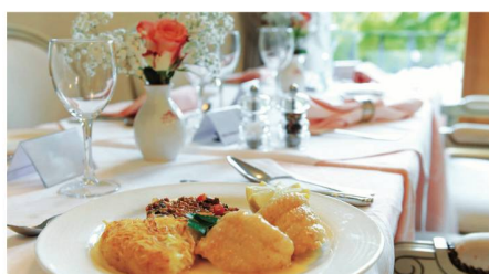
Une table et un service hôtelier de premier ordre.