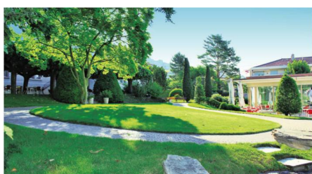
Les 3 bâtiments de l'établissement sont idéalement implantés au cœur d'un parc arborisé de 10'000 m 2 .